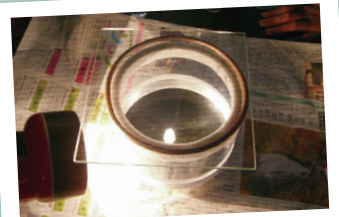
放射線の軌跡観察