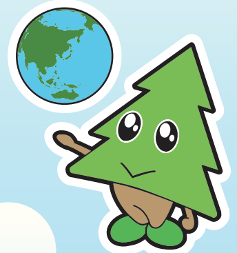
秋田県マスコット「スギッチ」

二ツ井伝承ホール Tel.0185-73-4002 〒018-3118 能代市二ツ井町字上台1-1